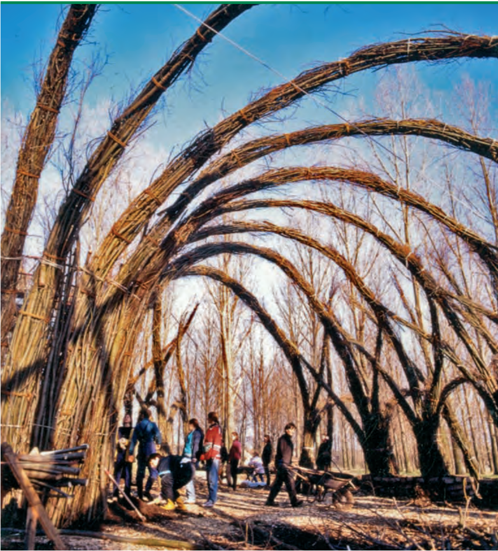
Jaky Roland de Mamajah encadrant des jeunes bénévoles durant la construction d'un palais de saule vivant