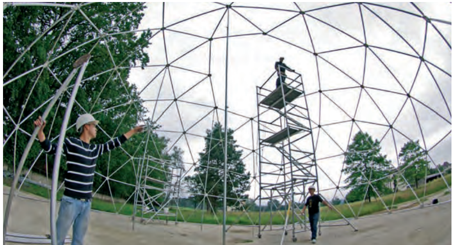
Montage d'un SwissDôme de Mamajah à Loëx destiné à servir d'atelier polyvalent