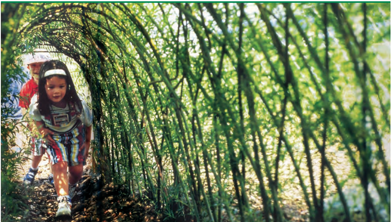
Le saule vivant permet d'aménager des espaces ludiques qui ravissent les enfants de tout âge!

et décoratif. Plutôt que d'importer les matières premières servant à la confection des installations de fêtes réalisées par Mamajah, celles-ci seront ainsi produites et transformées sur place. Des petites cultures vivrières et la présence d'animaux sur le site complèteront le caractère didactique du projet. Ce lieu convivial d'activité de plein air servira également d'outil de prévention et de médiation en favorisant la relation inter-générationnelle, en particulier celle des jeunes concernés et leurs familles.